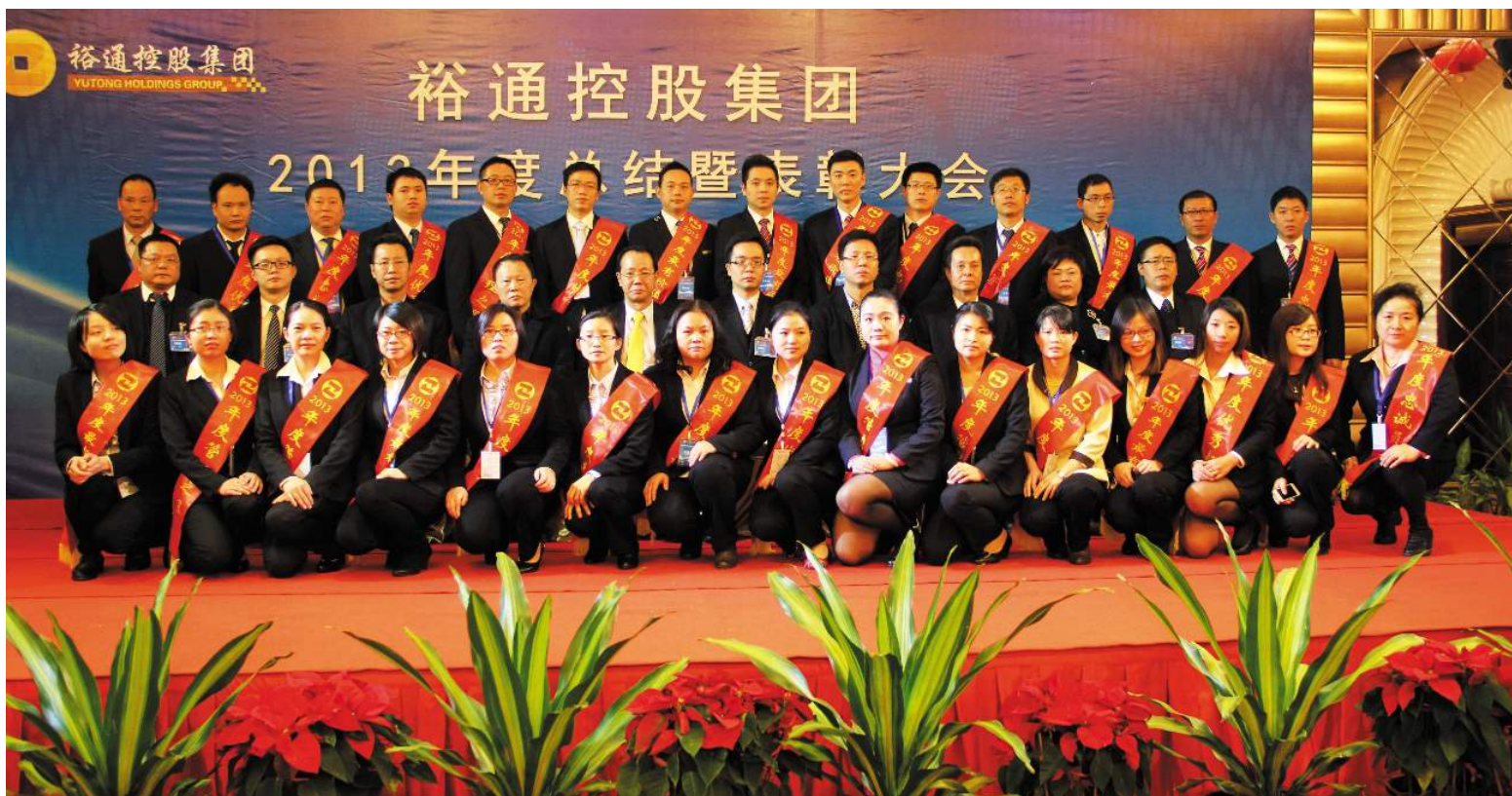
■裕通控股集团 2013 年度工作年终总结暨表彰大会高层领导与受表彰人员合影

本报讯(杨莉/文)2014年1月22日,裕通实业控股集团有限公司在广东汕头潮阳区举办了2013年度工作总结暨表彰大会、“中国梦·裕通情”迎春文艺汇演、集团迎春晚宴三场隆重的大会,在集团及各子公司的充分筹备及支持下,三场大会均取得盛大成功,为裕通集团2013年的整体工作划下了圆满句点,并为2014年的工作开展带来良好的开端。