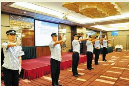
■保安部参赛选手展示车辆指挥手势

本报讯(刘健彬/文)2013年7月,广东裕通大酒店2013年服务技能大赛在酒店二楼美洲厅隆重举行并圆满落幕。本次技能大赛共有餐饮部、房务部、财务部、保安部、工程部5个部门参赛,比赛设有中式宴会摆台、西式宴会摆台、前台接待服务、收银操作、中式铺床、消防装备穿着、电子门锁检修、英语服务问答等多个比赛项目,酒店一众精英好手同场竞技,尽情展示了酒店的服务精神和员工良好的精神面貌。