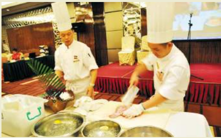
■中餐大厨的才能展示