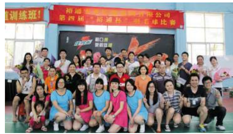
第四届“裕通杯”羽毛球比赛获奖选手合影

本报讯(李楷瑞/文)2013年7月27日,裕通实业控股集团有限公司第四届“裕通杯”羽毛球比赛在邮电小区天信羽毛球馆隆重举行,来自广州区域的裕通集团总部、裕通集团总部、广东裕通大酒店、裕通建工实业集团、广东鑫诺设备科技有限公司、广东裕通科技股份有限公司均派出代表队参赛。