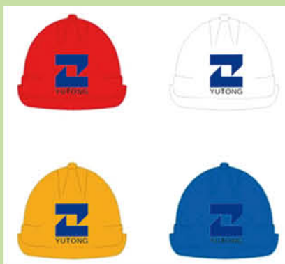
附图一:“裕通”标志的安全帽

信息化管理是企业应对“营改增”的必要支撑。建筑业庞大的增值税收信息量和管理单元(项目部及分公司)分散,国家针对增值税做出了严格的要求:四流合一(合同、物流、发票流、资金流)征管稽查体系,决定了信息化管理是应对“营改增”和控制风险的唯一出路。“营改增”后,如果不加强管理,增值税税负将比此前的营业税负大幅增加,而且增值税管理涉及核算进项、销项、转出等复杂发票管理业务,我司发票管理量大、点多(分支机构及项目部多)、线长(大项目需要跨年度完成,时间长)、面广的特点,税务管理、发票管理将是“营改增”后我司急需打造的核心竞争力。为此,我司采取了强有力的应对措施,加大企业内部“营改增”学习力度和加强“营改增”的相关职业培训,对内对各分公司项目部加大宣传力度,把“营改增”对企业的影响情况向合作单位进行宣传,特别是经营人员、计划人员、成本核算人员、财务人员等,进行相关的培训,培养一支有较强应变能力的员工队伍,并对公司的相关管理规定、协议及合同范本做了相应的调整,全面掌握“营改增”的信息,为各项经营管理变革,提高工作的前瞻性、可预见性打好基础。