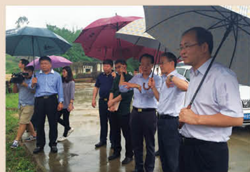
▲ 5月9日,清远市委书记葛长伟(右二)对农业合作项目进行考察。

项目建成以后,将形成一个功能齐全、服务完善、运转高效的现代化农业园区,引领当地乃至佛冈县由传统农业向现代农业迈进,实现跨越式发展,并借助“聚核效应”,加速当地一、二、三产业深度融合,促进农民增收、农业转型和农村发展,为当地人民共同富裕探索一条新的道路。