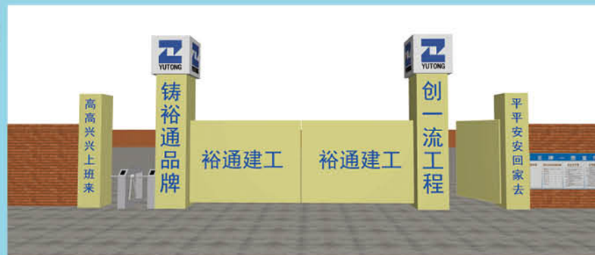
附图二:工地大门外立面形象

“建工集团分公司及项目管理系统”为多部门一体化协作平台的信息化管理,全面打通各部门涉税相关信息集成管控,应对“营改增”。支持多组织架构(各分公司)支持项目独立核算的管理模式,构建集中和统一的管理平台,实现一套帐管理,应对“营改增”对建筑行业资质共享模式的变化,加强供应商信息管理和供应商涉税信息管理,建立企业级供应商库。规范投标管理、合同管理,保障进项税票取得,优化“营改增”后的价格管理,按净利润最大化模型,实现税负及成本之和最小化模型;提供报价对比工具,提升价格管理能力。系统强化标准化合同模块,强化合同评审及审批管理存档规范;规范合同管理,通过信息化软件平台的建立,应对“营改增”后的合同风险,目前我司信息化管理软件的开发工作正在进行之中,计划今年年底上线试用。