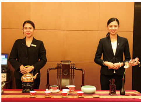
热茶以待 (广酒李梦元供稿)