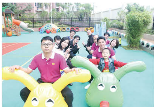
重拾童真 (汕酒郑泽华供稿)