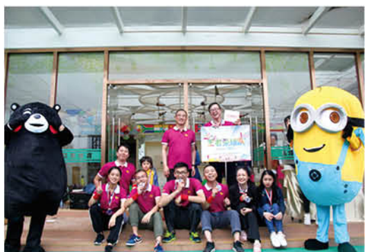
我们是王者 (汕酒黄晓莉供稿)