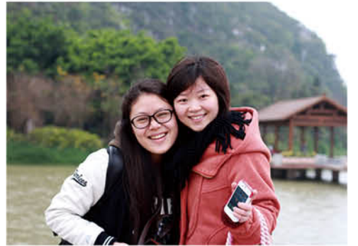
姐妹花 (建工陈惠植供稿)