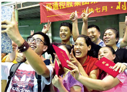
庆祝胜利