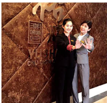
青春笑容