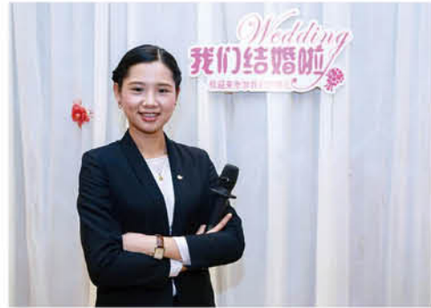
婚礼主持 (广酒李梦元供稿)