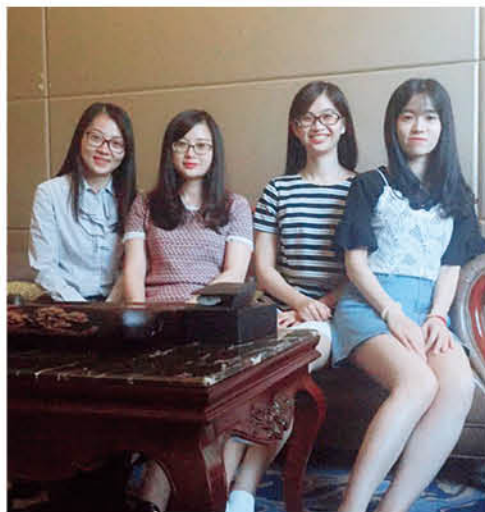
年轻的心