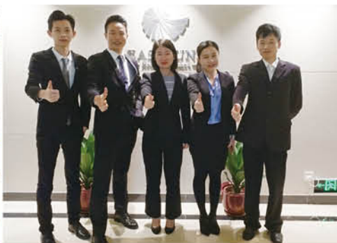
我们是最棒的 (广酒李梦元供稿)