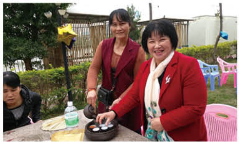
来, 喝杯功夫茶 (汕酒黄晓莉供稿)