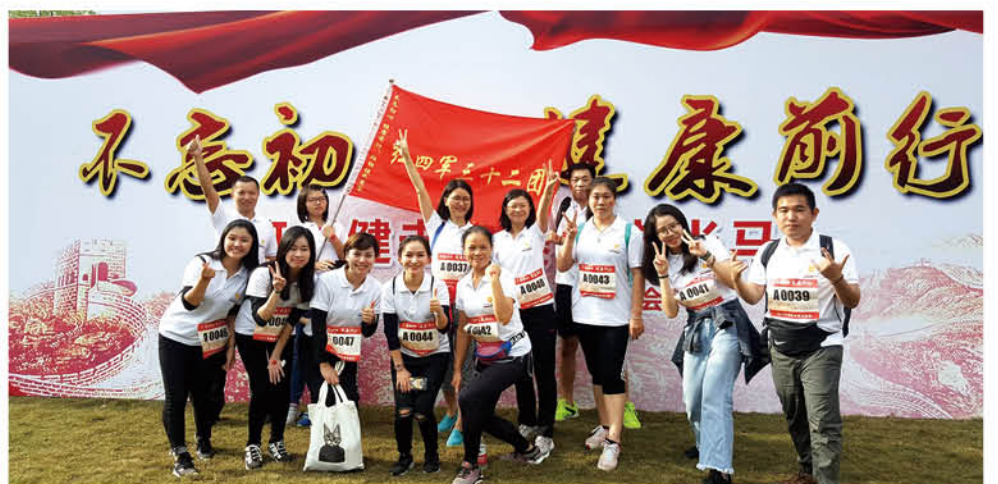
再次出发