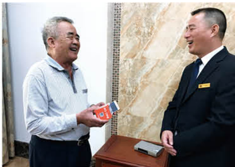
业主物业一家亲 (中港物业肖晓琼供稿)