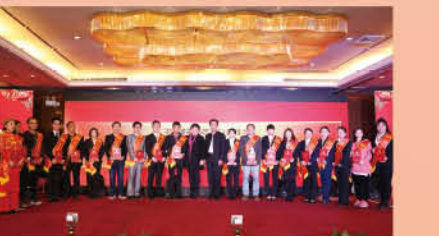
最具价值员工颁奖