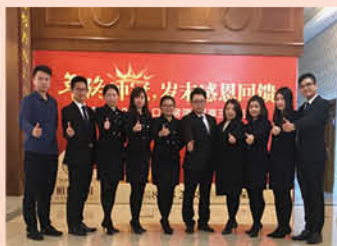
裕通房地产营销策划部